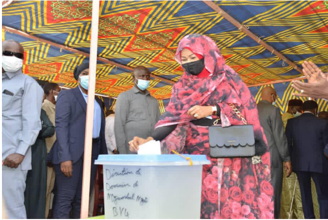
Hinda Déby Itno