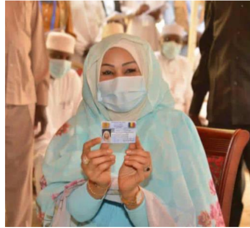
Hinda Déby Itno

KOPP France est une entreprise française familiale fondée en 1965 spécialisée dans la sécurisation de sites sensibles (obstacles anti-véhicules béliers, protection périmétrique et balistique) ainsi que dans la gestion de l'identité (production de titres sécurisés, biométrie, solution de lutte contre la fraude documentaire).